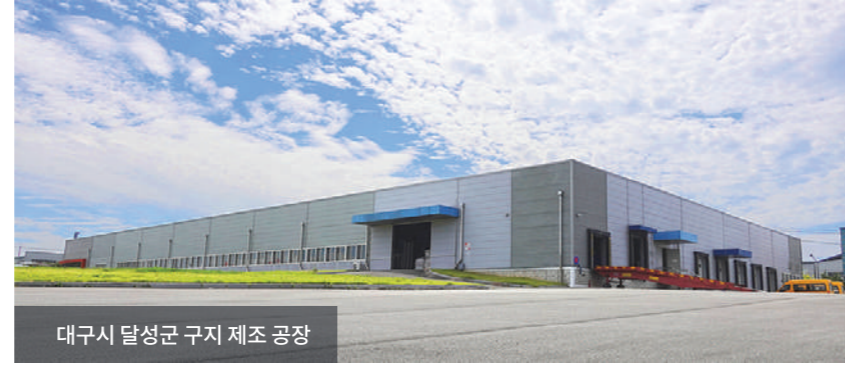
대구시 달성군 구지 제조 공장

디지털 차량 키 APP 출시, 관제단말기 SW업그레이드, 각종 사용자 편의개선 등 끊임없이 연구하고 투자합니다.