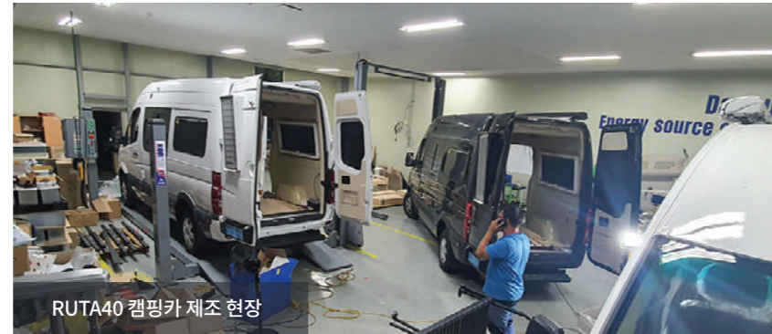
RUTA40 캠핑카 제조 현장